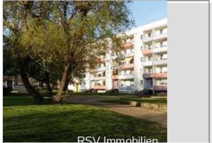
RSV Immobilien Ansicht 2