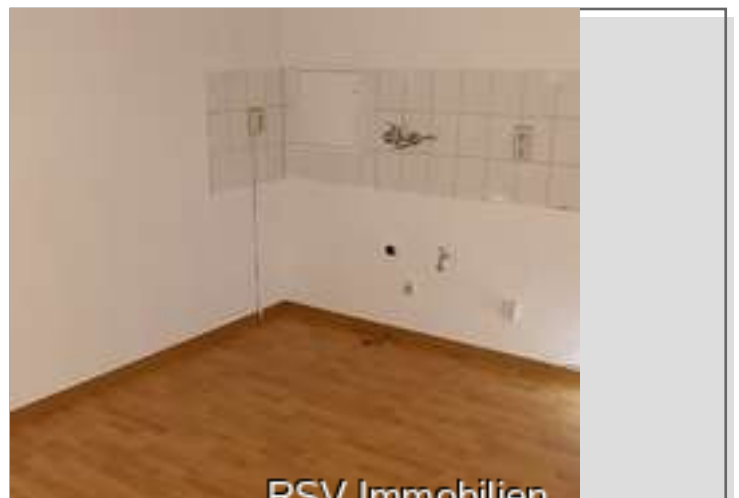
RSV Immobilien Küche 1