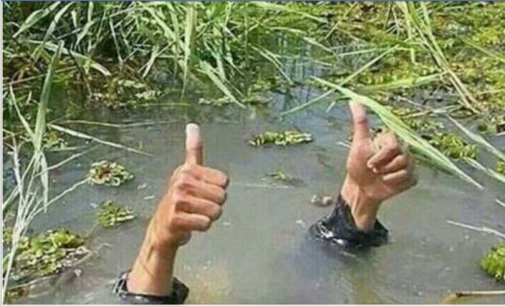
Wenn Sie nicht wissen, wohin ?