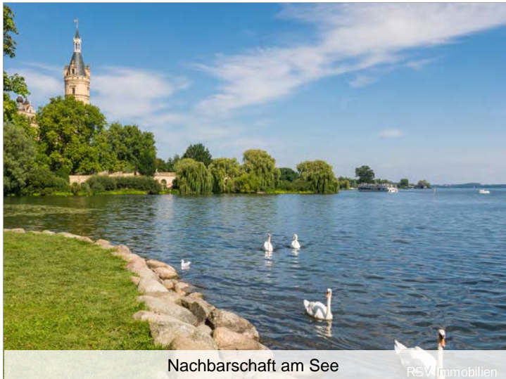
Nachbarschaft am See