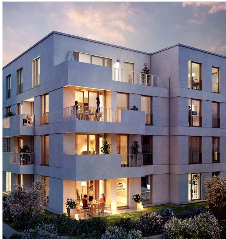
Ansicht bei Nacht 1