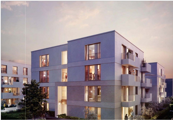
Ansicht bei Nacht 2